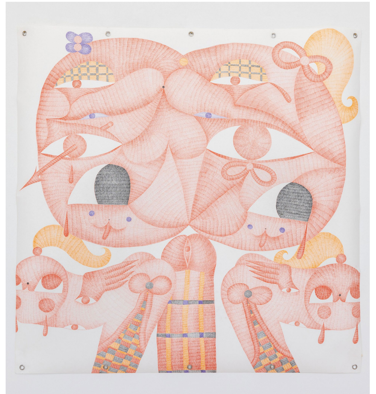
Look at me , 2022 Crayon de couleur sur papier 150 x 150 cm

Chicken lips , 2022 Crayon de couleur sur papier 150 x 300 cm