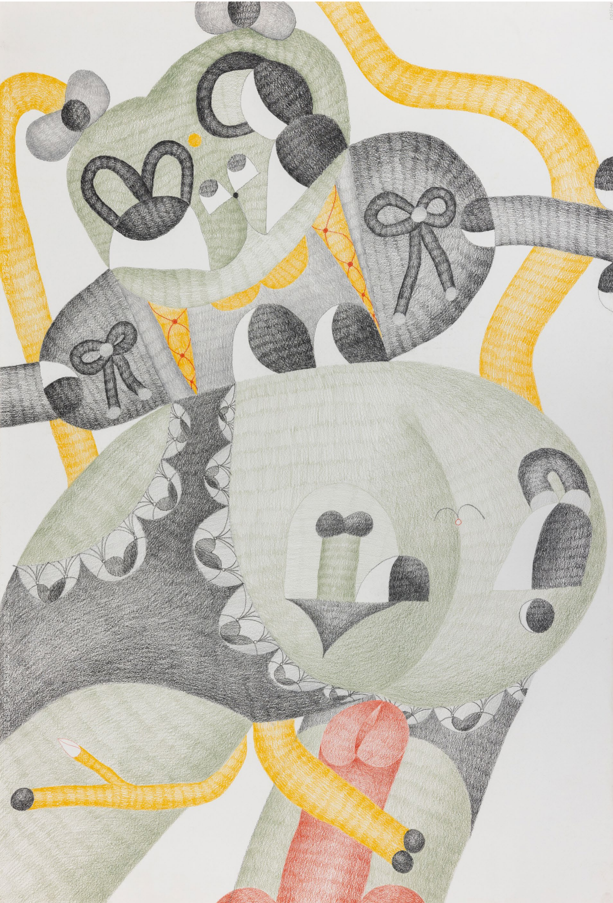
The Scarlet Flower, 2021 Crayon de couleur sur papier 110 x 75 cm, framed