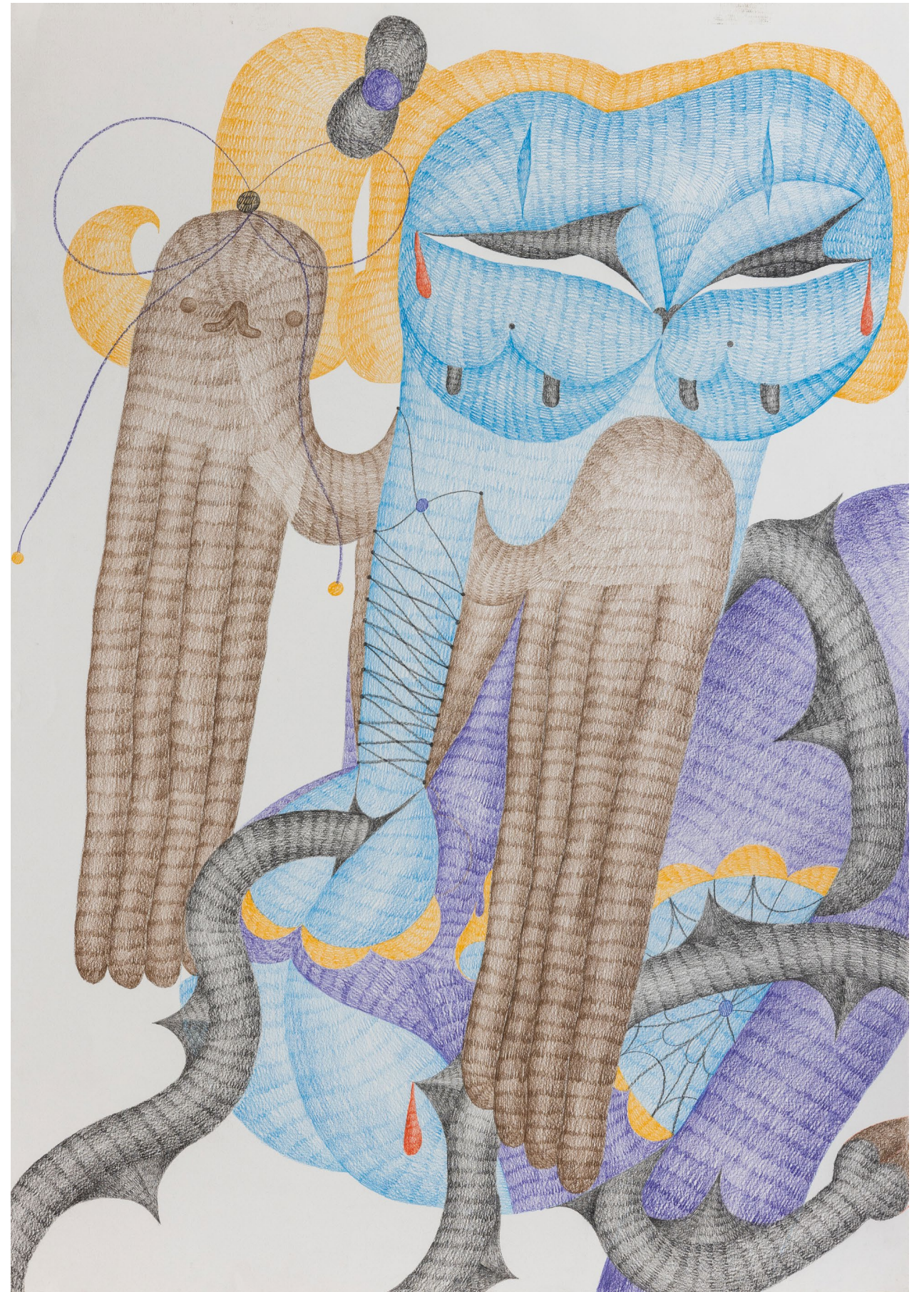
Feel free , 2022 Crayon de couleur sur papier 100 x 70 cm, framed

En effet, l'œuvre de Love Curly procède comme une thérapie, au soin et au dépassement de soi. Rassemblés à la galerie Strouk, soit dans un même lieu assez grand pour les accueillir pour la première fois depuis l'exil de l'artiste, ils sont pour elles dans cet espace comme une maison dans laquelle elle nous invite à partager cette réalité sous tension. Ainsi, elle s'empare de l'espace de la galerie, dans lequel elle se sent en sécurité, entourée de ses rêves qui tirent entre limbes et réalité.