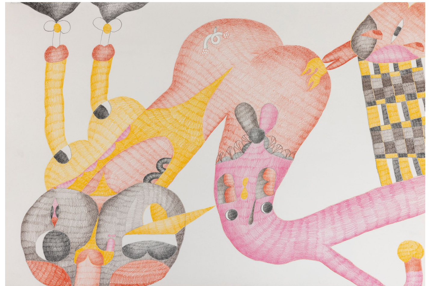
With pleasure N1 , 2021 Crayon de couleur sur papier 75 x 110 cm

Ce sont ces couleurs vives et ses formes ambivalentes qui la protègent. Elles reflètent sa réalité : une condition en proie à une réalité politique et d'actualité, dont il est alors difficile d'échapper sans qu'on y soit identifié. Le dessin permet aussi bien à Love Curly de se protéger que de s'affirmer à travers cette nouvelle réalité. Basés principalement sur ses émotions, ses dessins lui permettent en partie de garder une connexion avec le reste du monde malgré la violence qui le constitue.