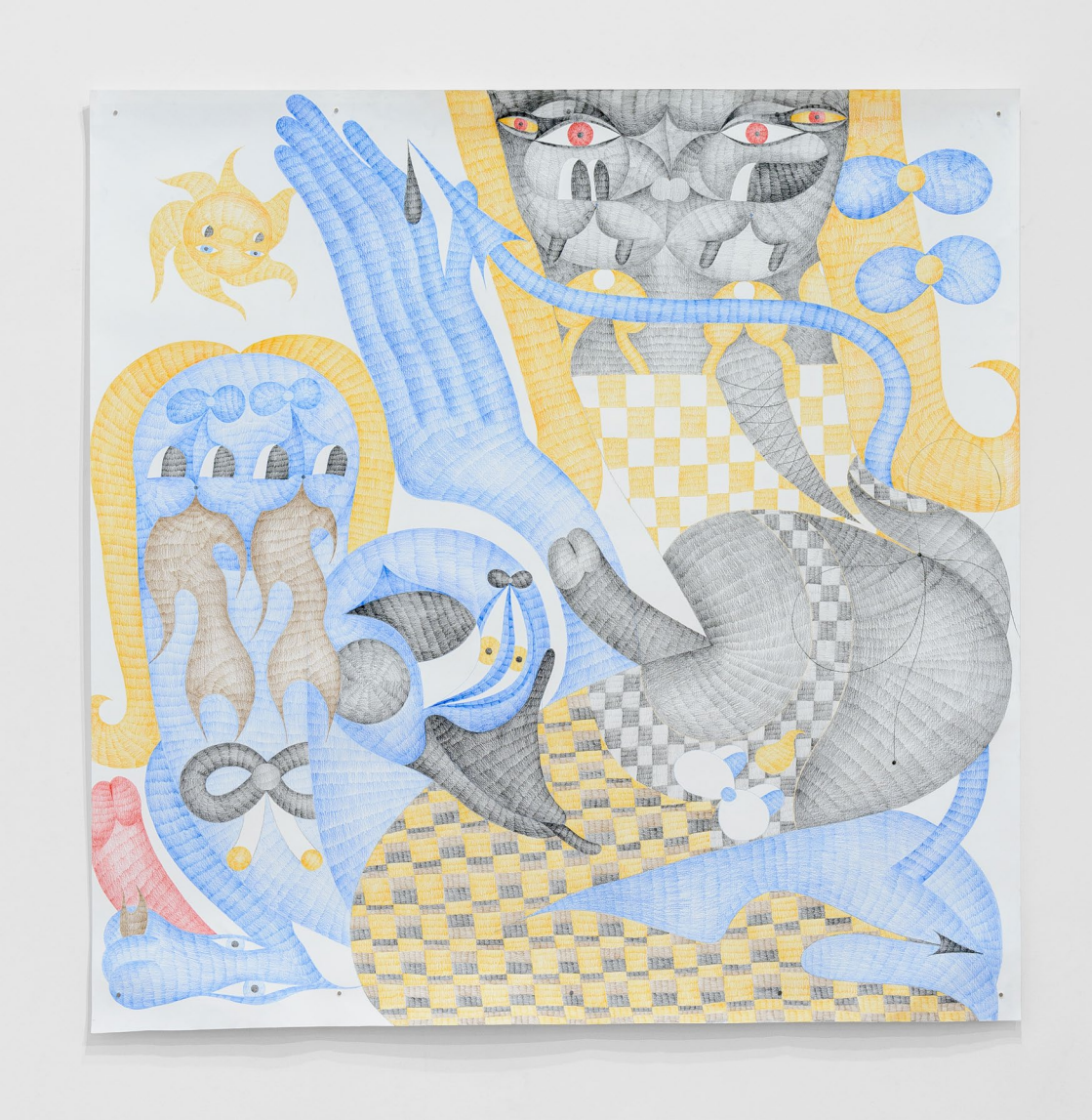
Keep shining, Nina, 2022 Crayon de couleur sur papier 150 x 150 cm