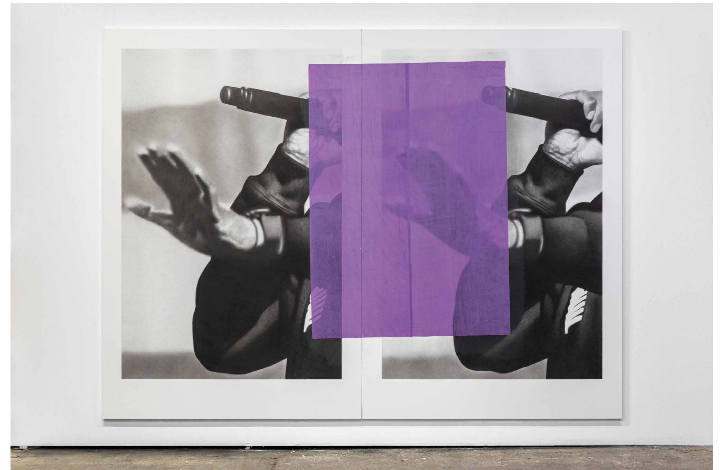
Affiché(es) 11, 2021 Fusain et papier coloré sur papier marouflé sur bois, monté sur châssis 195 x 260 cm, unframed