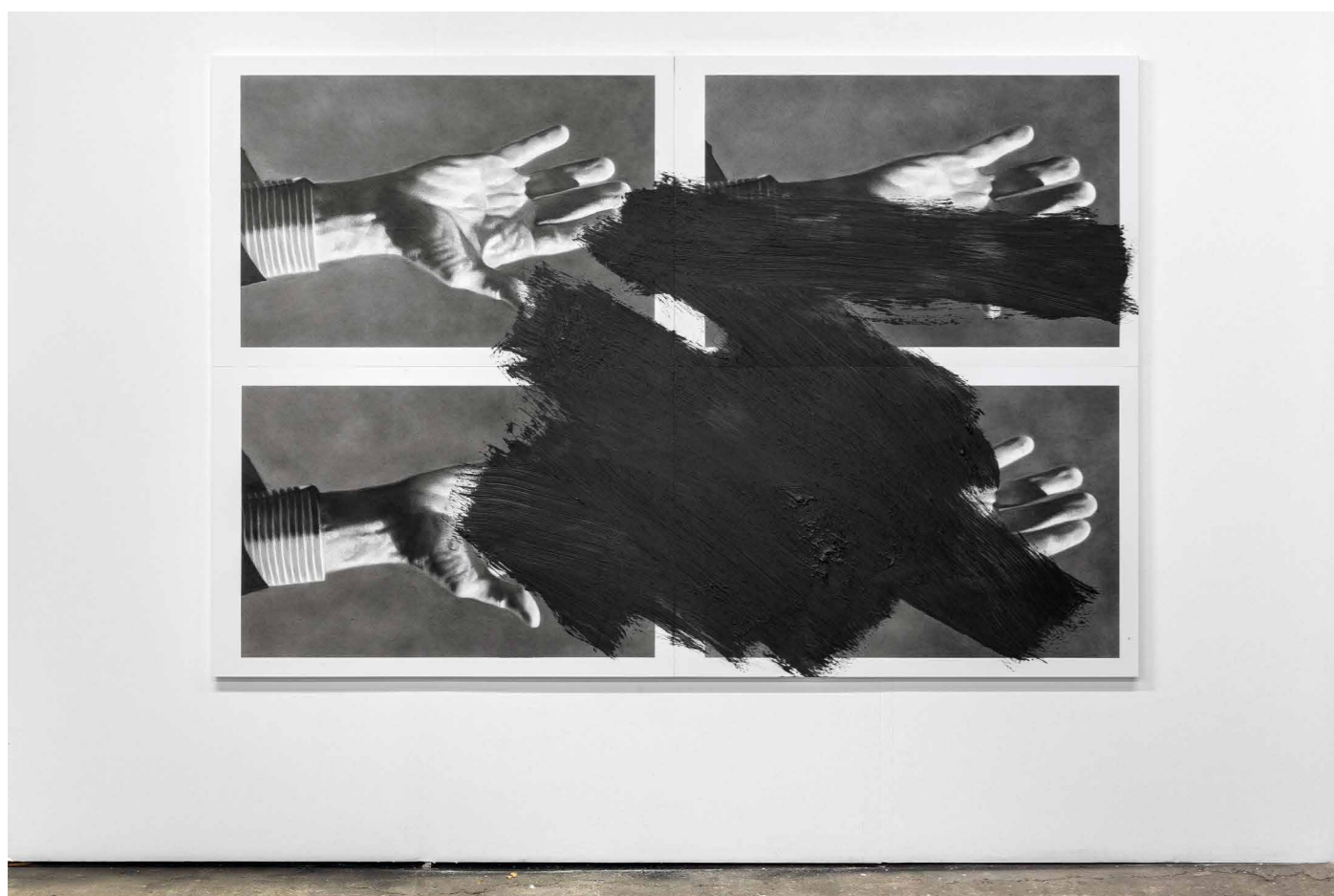
Sans titre mains, 2021 Fusain, pierre noire et peinture à l'huile sur papier marouflé sur bois, monté sur châssis 160,5 x 240,5 cm, unframed

Ce rapport entre image et mémoire nourrit la recherche plastique de Valentin van der Meulen et constitue le socle intime de son travail : une fois ses dessins réalisés, il s'attache à les altérer si bien qu'il en brouille le sujet : l'action performative laisse des traces indélébiles, autant de preuves que l'image a été digérée avant d'être recrachée, que ce que nous voyons est en fait la mémoire d'une image, elle-même devenue image qui en nous redeviendra mémoire.