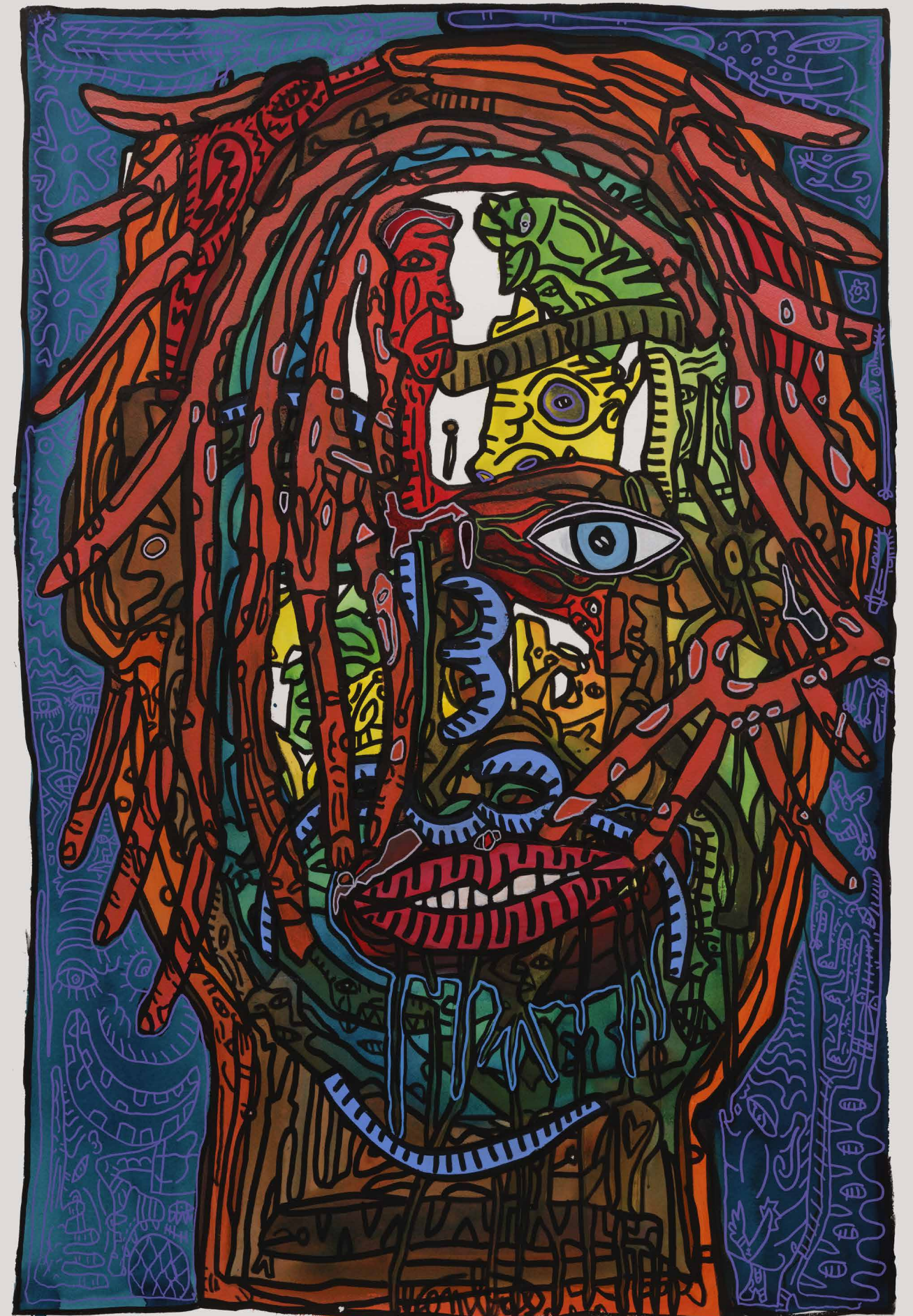
CLIN D'OEIL DU ROUQUIN À QUELQU'UN, CE QUI VEUT DIRE TOI ! 150 x 100 cm Peinture et encre acryliques sur papier Vélin d'Arches 2020

A partir de là, comment s'articule son rapport à l'altérité, sa relation personnelle à sa propre image dans le regard de l'autre ? Avec une joie créatrice, une rage d'outrance, le peintre peuple de son nouveau monde polychrome des grandes feuilles Vélin d'Arches de 150 x 100 cm. Connu pour peindre sur tout ce qu'il trouve, Combas a choisi aujourd'hui un support plus classique avec lequel il joue sur la nature même du papier : absorption des encres et de l'acrylique, travail sur différents plans enluminés, rehauts au stylo feutre, nuances subtiles des dégradés des pigments de couleurs, tout s'enchevêtre dans ses flambées de peinture, stridentes et sublimes.