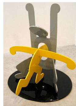
1. Sans titre , 1984, acrylique sur toile (152 x 152 cm). 2. Sans titre , 1982, encre sumi sur papier (97 x 127 cm). 3. Sans titre , 1987-89, sculpture en aluminium peint (140 x 139 x 128 cm).

A l'occasion du 50 e anniversaire de sa naissance, la galerie Laurent Strouk rend hommage au prince du graffiti, Keith Haring (1958-1990), laissant son esprit et ses couleurs envahir tant les cimaises que les vitrines ! Parallèlement à la grande rétrospective du musée d'art contemporain de Lyon, pour laquelle la galerie a prêté des œuvres de qualité ( Sans titre , acrylique sur bâche, 1983), elle présente dans son espace une vingtaine de pièces inédites : peintures, sculptures et dessins . Un événement exceptionnel car peu de fois autant d'œuvres de Keith Haring n'ont été réunies en galerie. Elles illustrent bien l'originalité de l'artiste dans son choix de divers supports d'expression : acrylique sur toile, sur bois ou sur cuir ; vinyle sur bâche, émail sur métal, encre sumi sur papier, aluminium sculpté et peint.