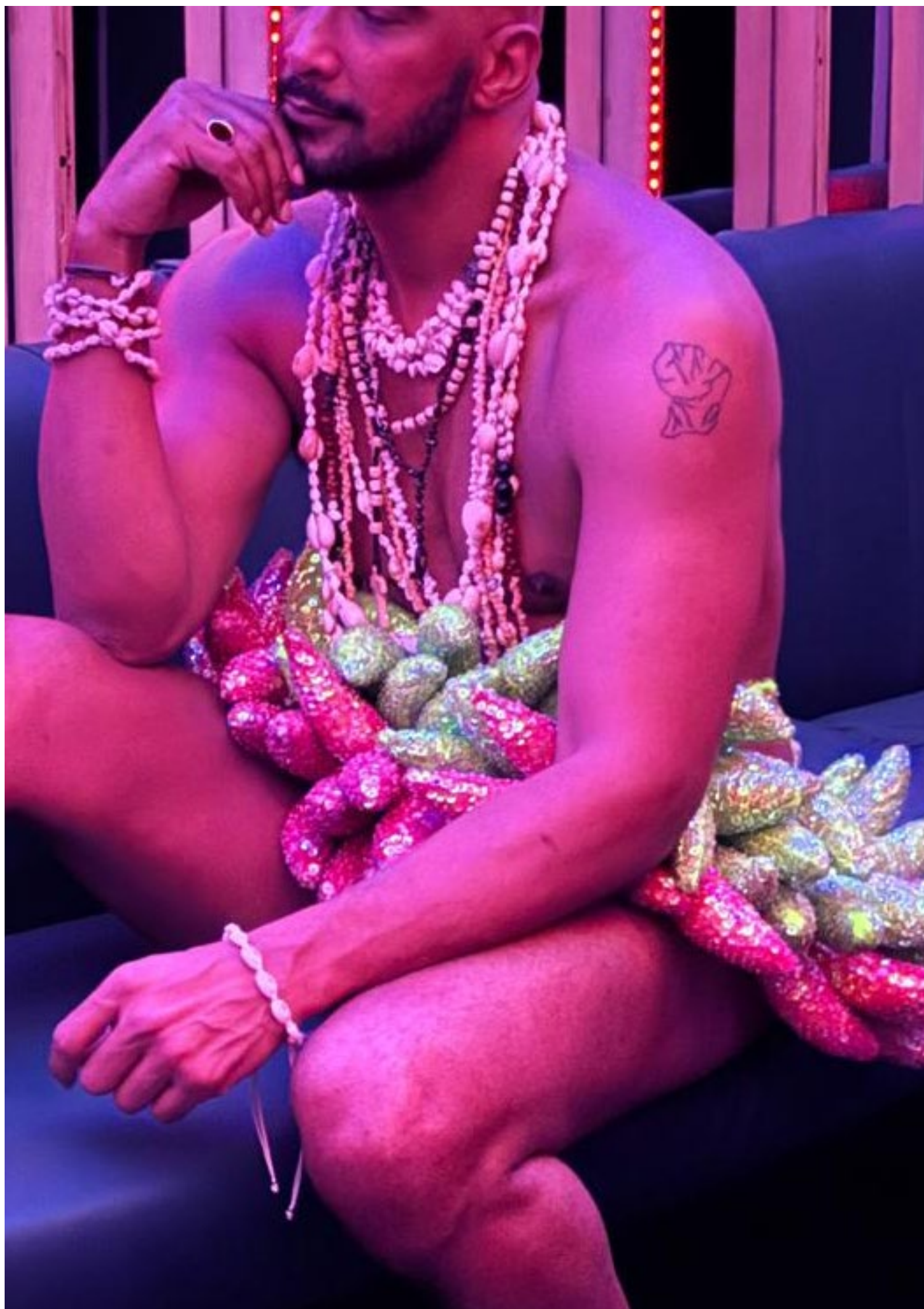
Zoulikha Bouabdellah, La Folie du Jour , 2025, Video still