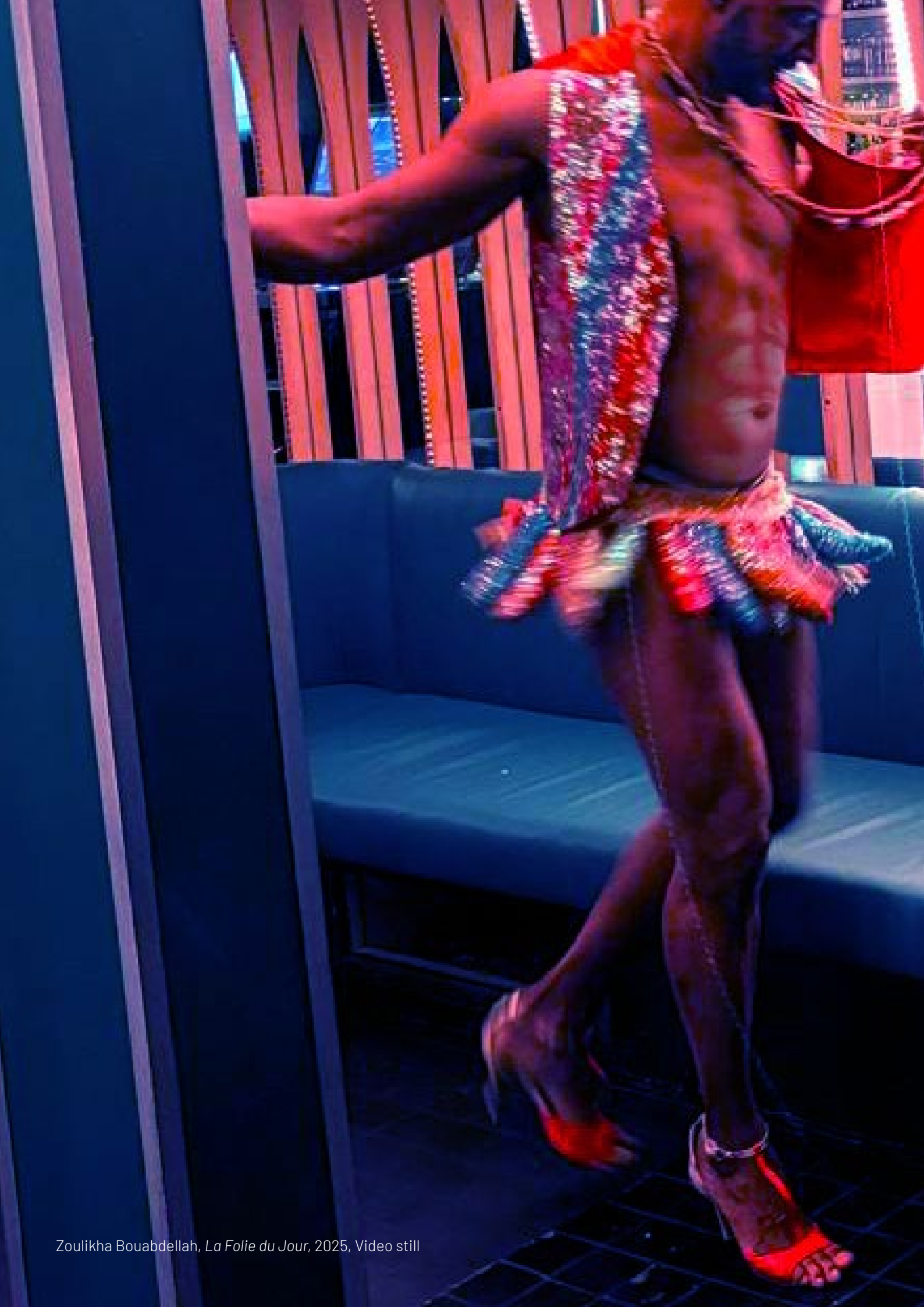
Zoulikha Bouabdellah, La Folie du Jour , 2025, Video still