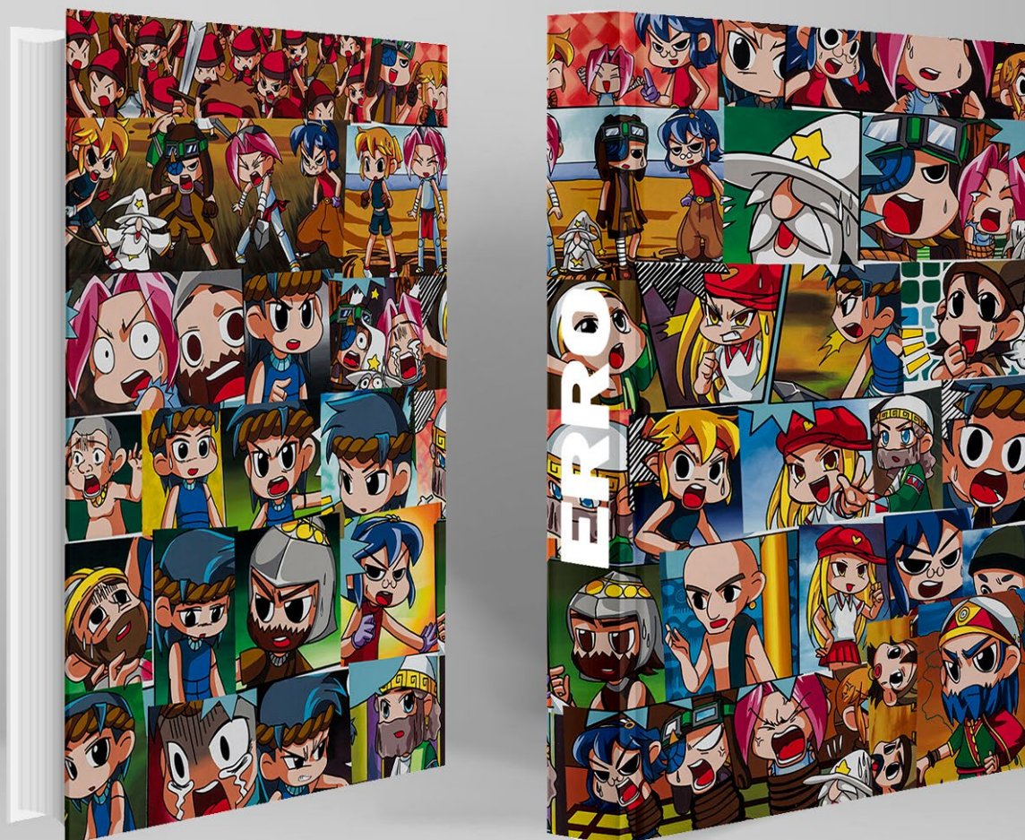
ERRÓ - Catalogue d'exposition, sur les presses d'Imprimerie Marie, Honfleur - Texte de Jill Gasparina (Texte publié originellement dans le catalogue Erró, Rétrospective , T. Raspail et D. Kvaran (éd), Mac Lyon, Somogy, 2014, catalogue publié à l'occasion de l'exposition présentée au Mac de Lyon, du 3 octobre 2014 au 22 février 2015.)